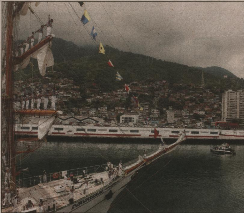
Buques escuela de 11 países, encabezados por el Simón Bolívar y las llamadas "Velas Libertadoras", llegaron ayer al puerto de La Guaira. P4