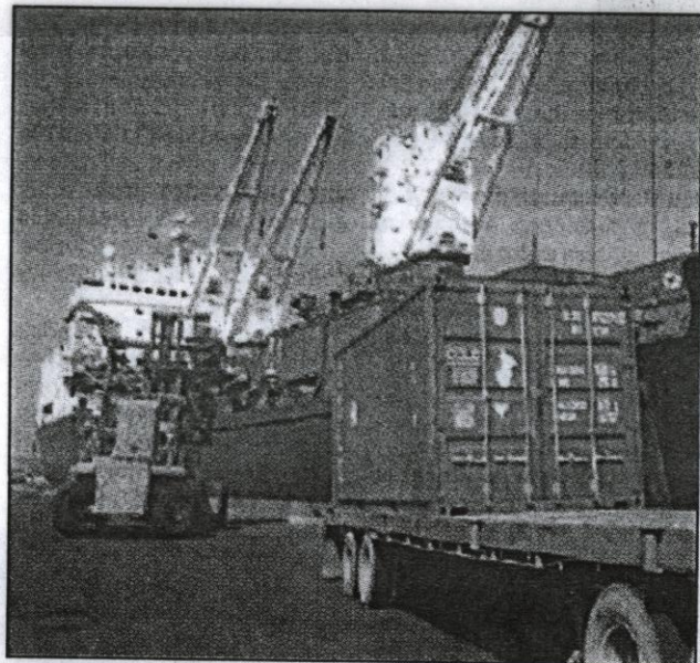
Restricción de importaciones traerá reacciones de socios comerciales

A pesar del fuerte incremento de salida de divisas y el aumento en el precio del dólar que se ha registrado en los últimos días, todavía el Banco Central de Venezuela cuenta con una serie de instrumentos para protegerse y evitar ese tipo de demandas, a juicio del presidente de Venamcham.